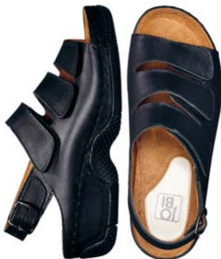
KOMFORTSANDAL I SKINN MED GELKUDDE I HÅLEN