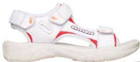
SPORTIG NUBUCK- SANDAL MED GRETE WAITZ-SULA