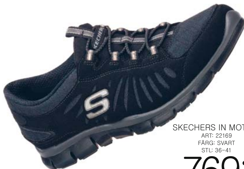
SKECHERS IN MOTION