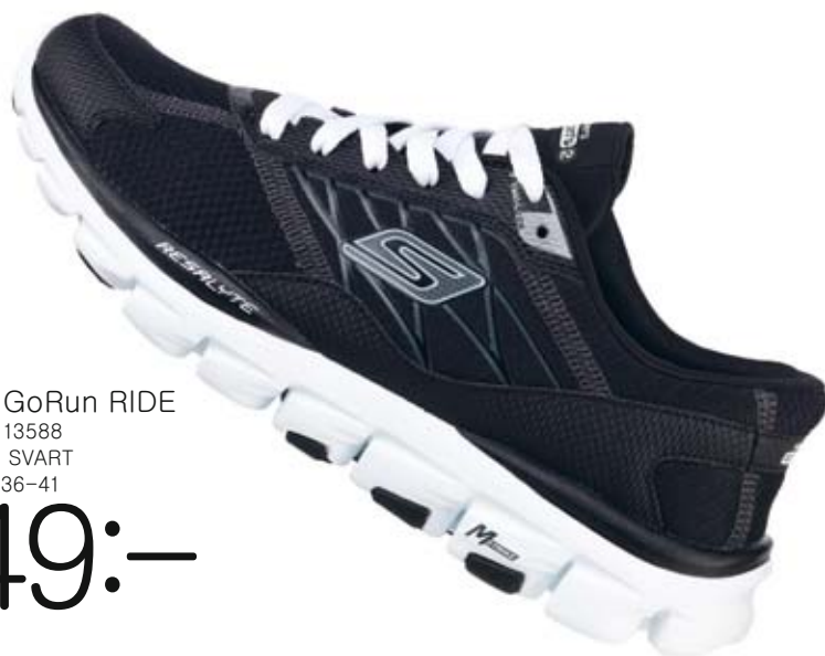
SKECHERS GoRun RIDE