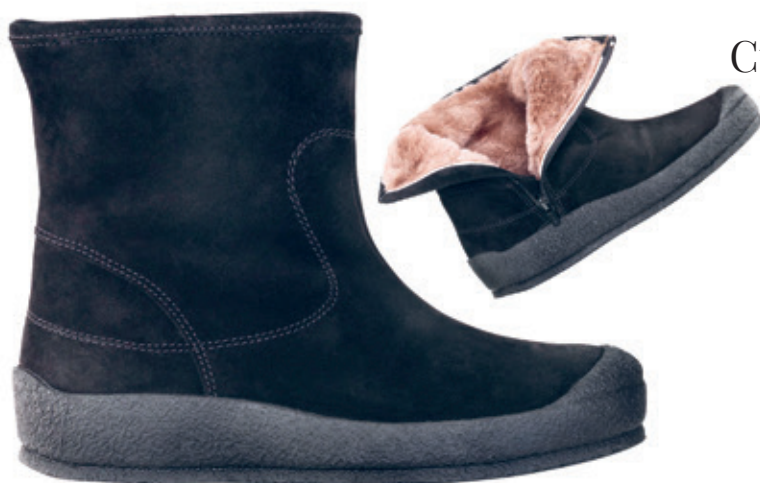
Curlingkänga i mockaskinn med Softsole innersula, äkt lammullsfoder, dragkedja på insidan