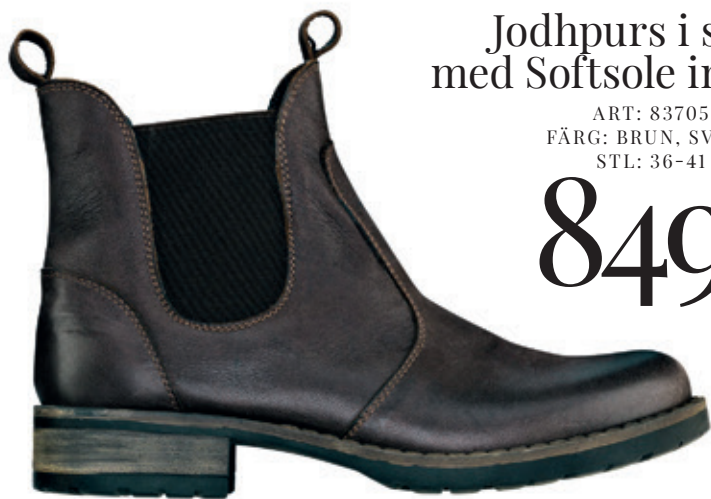
Jodhpurs i skinn med Softsole innersula

Knyck ett par klassiskt skraddade kostymbyxor ur hans garderob. Låna en stor, vid skjorta och låt manschetterna sticka fram ur kappärmen. Blanda och styla maskulina plagg med feminin elegans. Tweed och kritstreck vs silkiga toppar och mjuk päls. Stilen är välklädd med små mönster och finstämda detaljer. Färgskalan balanserad: kamel, jord, bordeaux. Fin fot med jodhpurs.