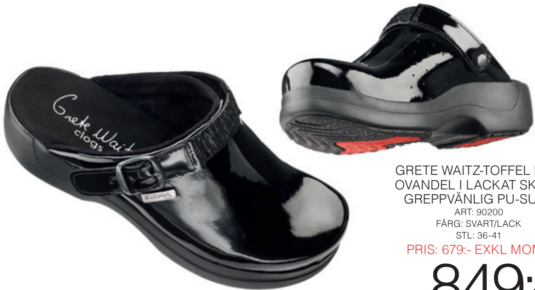
GRETE WAITZ-TOFFEL MED OVANDEL I LACKAT SKINN, GREPPVÄNLIG PU-SULA