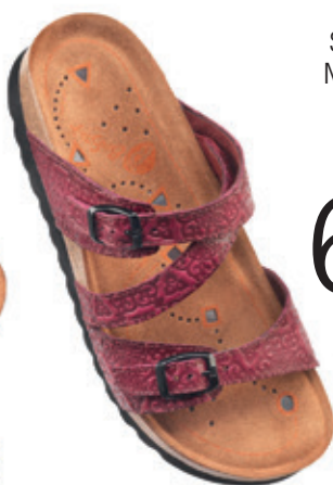
SANDAL MED MAGNETSULA