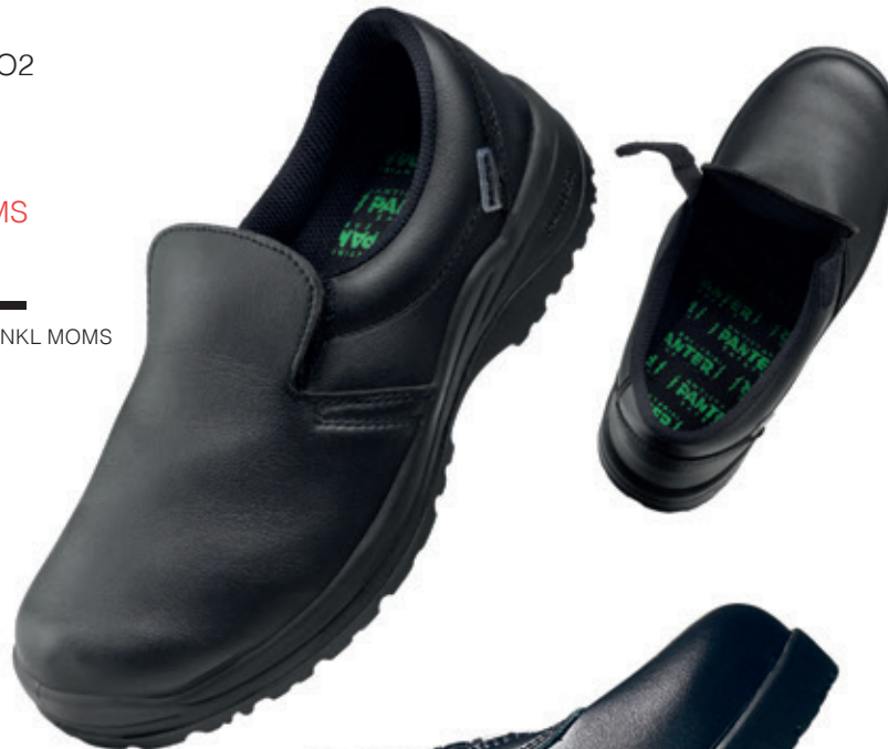
SIKA FUSION HALKKLASS SRC ANTISTATISK