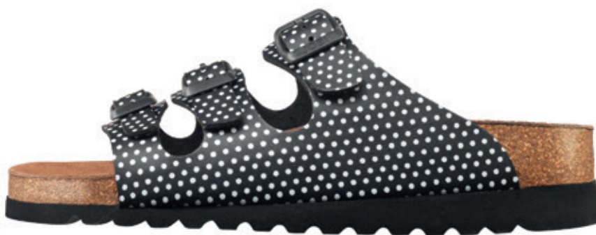
LÄTT SANDAL MED SOFTSOLE OCH KILKLACK

ART: 98200 FÄRG: SVART MED VITA PRICKAR STL: 36-41