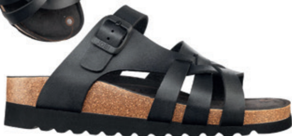
SKINNSANDALET MED MAGNETSULA, 50 MM KILKLACK